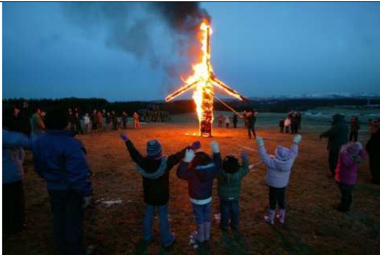
Les nouveaux feux de la Saint-Jean !

D'un anonyme commentant « le tourisme éolien » qui paraît-il attire beaucoup de curieux : « Ce n'est pas parce qu'on va voir la femme à barbe, que l'on a envie de vivre avec ! »